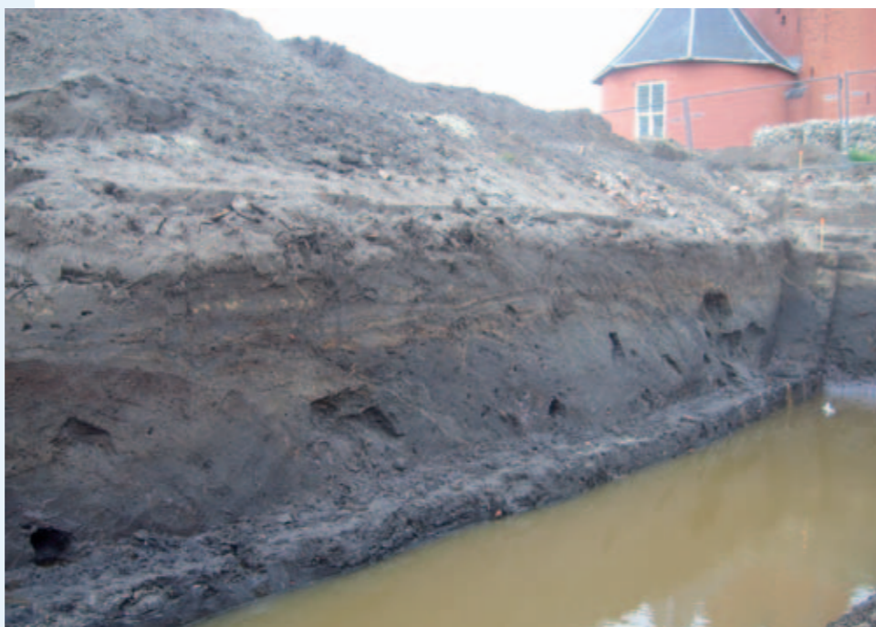
Insteek van de middeleeuwse mottegracht

Nu het Centrumplan in volle gang is, geeft de bodem van Coevorden langzaam haar geheimen prijs. Zo is bij het kasteel de middeleeuwse gracht aangesneden. Op de bodem van de gracht werd een houten bruggenhoofd aangetroffen, die waarschijnlijk deel uitmaakte van een brug naar de voormalige voorburch. Uit de grachtvulling kwamen o.a. kanonskogels, aardewerk en een ruw houten kistje met onverschoten walbuskogels (een soort geweer uit de 16de eeuw).